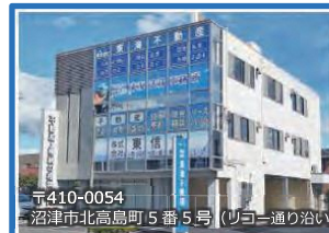
〒410-0054 沼津市北高島町5番5号(リコー通り沿い)